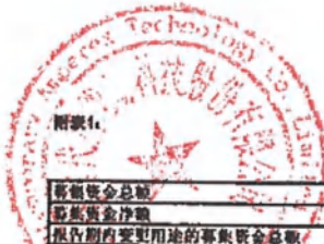
2023年度募集资金使用情况对照表